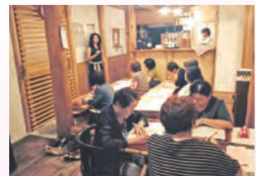
名前が上手に書けました

みなさんも、筆ペンを使うときは縦・横・斜めの線の書き方を練習してから書いてみてください。