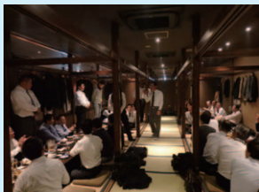
堀炬燵式の個室で大盛り上がり