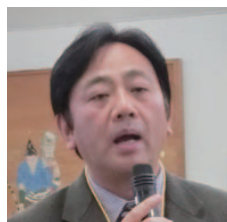
谷川次期地協会長