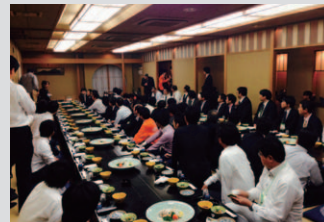
ふぐコース料理を堪能

11 月 8 日 (土) にホルトホール大分にて、スペース 21 全国協議会大分大会が開催されました。当日のプログラムは、1 部「大分の笑い〜なしかのこころ〜 講師:吉田寛」2 部「ワールドカフェ、オープンスペーステクノロジー 講師:福原美砂」の 2 部構成で、どちらも大変有意義な内容でした。懇親会は、臼杵特産のふぐコース料理を堪能。まさに充実の 1 日でありました。年々盛り上がりを見せるスペース 21 全国協議会、みなさまも是非一度ご参加されてはいかがでしょうか。(報告:平成会)