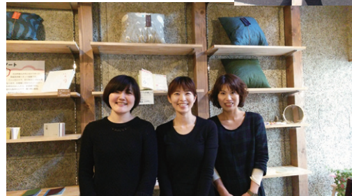
四天王寺の参道沿いにある『和紙のお仕立荘』