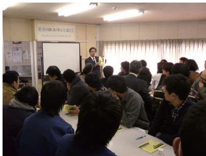
熱心に受講する組合員

議論の中で私の断裁作業における断裁機の使用法に特に大きな問題はなかったのですが、初めて耳にする