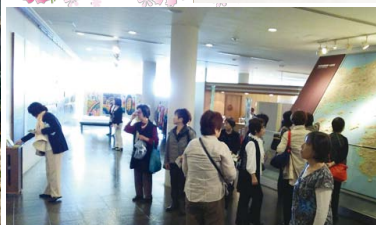
野島断層保存館にて 一阪神・淡路大震災の脅威を改めて知る