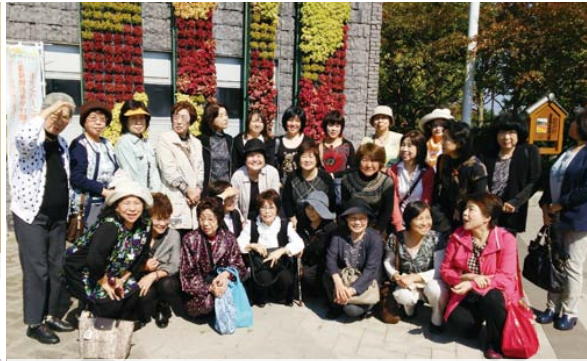
奇跡の星の植物館前で全員集合