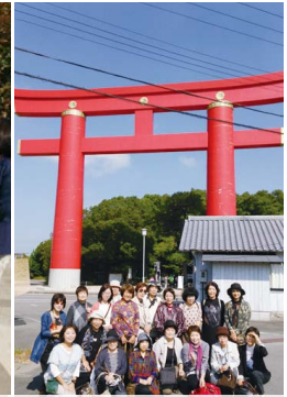
おのころ神社 大鳥居