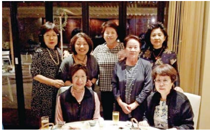
最高のお料理の前に