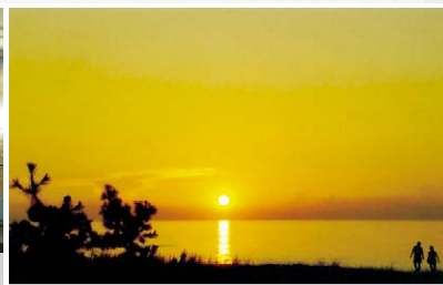
ホテルからの夕日は格別